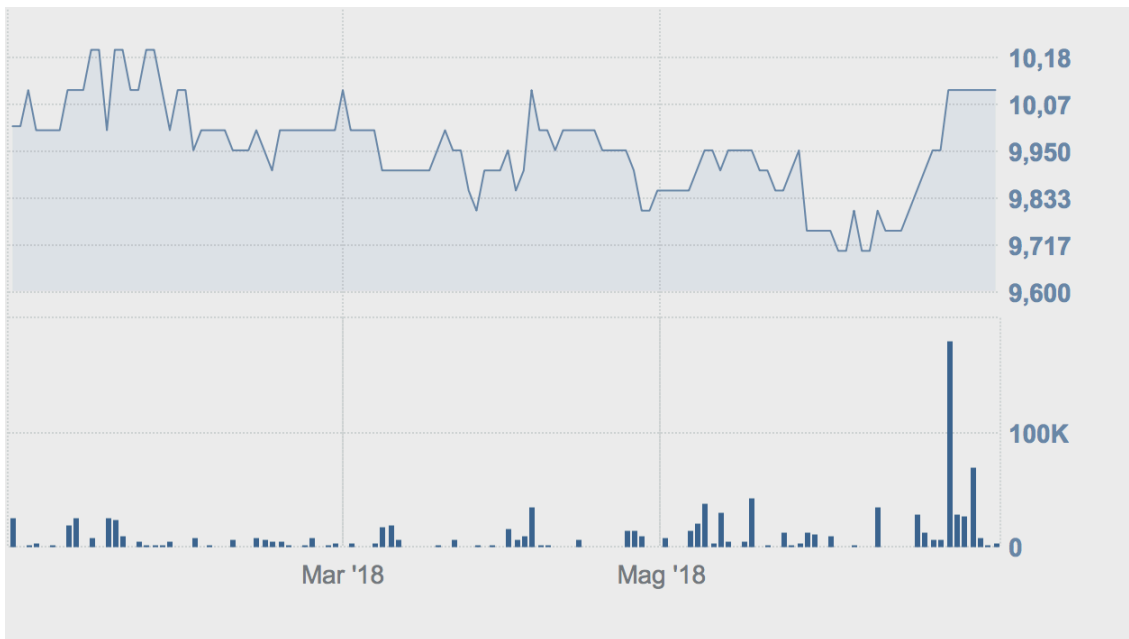
Andamento Warrant II1